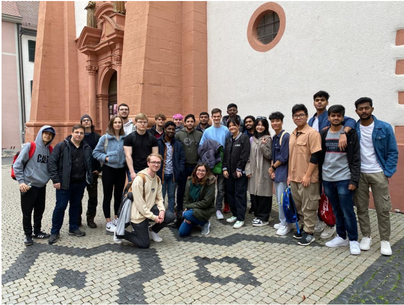
A freiburgi kirándulás alkalmával készült csoportkép, a furtwangeni Erasmusos hallgatókkal

Külön ki szeretném emelni, hogy az iskola által szervezett (kifejezetten Erasmusos hallgatóknak szánt) programok felülmúlták minden elvárásomat és reményemet. Nagyon sok lehetőséget nyújtottak számunkra, rengeteg programot szerveztek, amelyek, mind ugyanúgy működtek: előzetesen lehetett regisztrálni 1-1 programra, mindegyiknek egy 10 eurós hozzájárulás volt az előfeltétele, amely valljuk be, igen csekély összeg, hiszen busszal vittek-hoztak bennünket, minden belépőnket az iskola finanszírozta, nekünk semmit sem kellett megszerveznünk, csupán megjelenni a kirándulások reggelén a buszmegállóban. Így juthattam el a következő helyekre: Freiburg, Konstanz, Hohenzollern-kastély, Stuttgart Mercedes-Benz Múzeum, Heidelberg, Esslingen karácsonyi vásár.